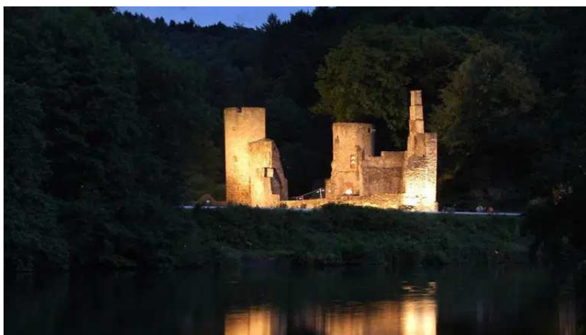
Burgruine Hardenstein bei Nacht (Foto: Barbara Zabka)

VON: BARTECZKO/STROHDIEK 6. OKTOBER 2015