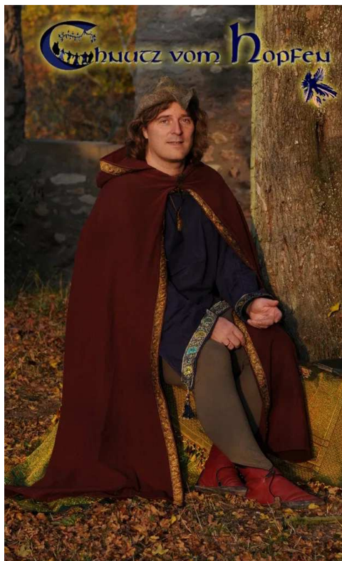
Geschichtenerzähler Chnutz vom Hopfen

Geschichtenerzählers Chnutz vom Hopfen sind Geschichten aus dem Mittelalter, vom Stricker über